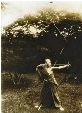
本多利實 (としぎね) (1836—1917)