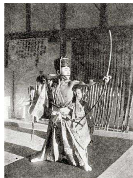
本多利時 (としとき) (1901—1945)