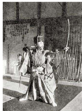
本多利時 (としとき) (1901—1945)